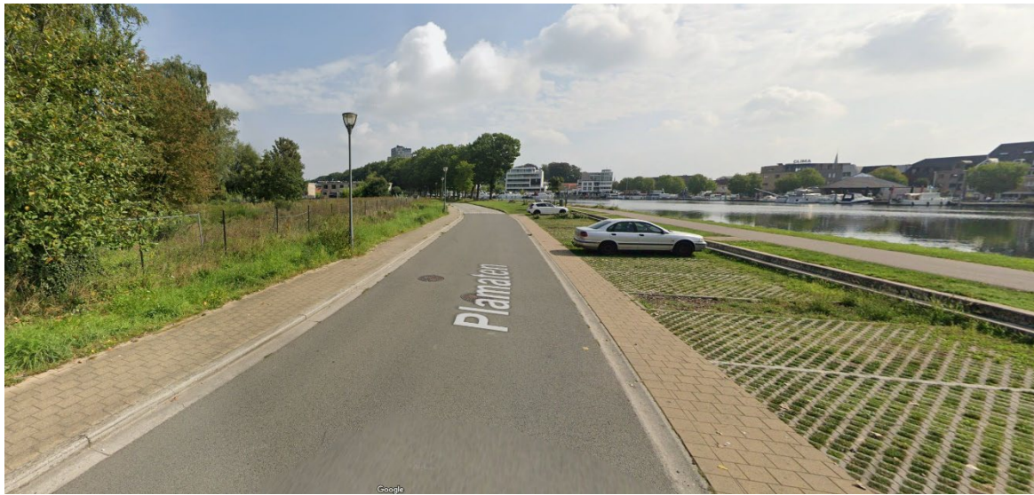
Bevoorradsingszone Plamatoren (overkant aankomst)