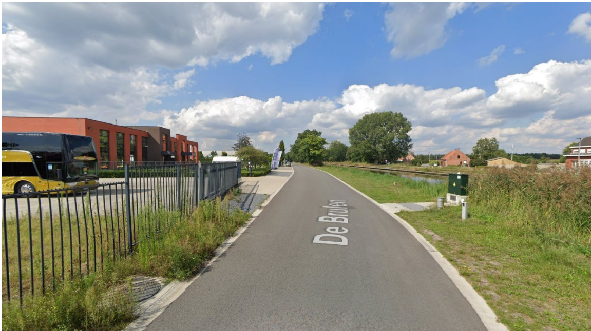
Bevoorradsingszone De Brulen – Arendonk